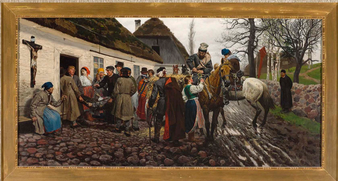
Ranny powstaniec, Stanisław Witkiewicz. Obraz ze zbiorów Muzeum Narodowego w Warszawie