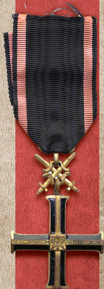
Krzyż Niepodległości z mieczami