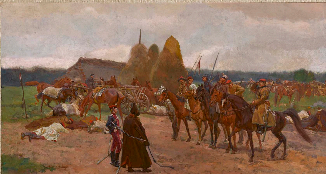
Epizod z powstania, Józef Chelmoński. Obraz ze zbiorów Muzeum Narodowego w Warszawie